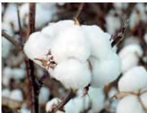
Les capsules de coton s'ouvrent et laissent s'échapper les fibres de coton.

Les fils de coton proviennent des fibres qui entourent les graines du cotonnier.