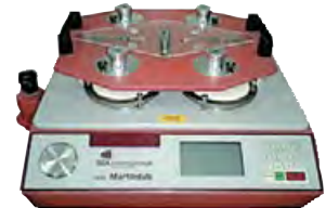
Machine utilisée pour tester la résistance à l'abrasion et le boulochage

La résistance à l'abrasion désigne la capacité d'un tissu d'ameublement à endurer l'usure. Elle indique à quel point une étoffe résiste à la « rupture ». En général, cette résistance est mesurée à l'aide de la méthode Martindale, qui consiste à soumettre un échantillon de tissu à des cycles de frottement dans une machine. Ce procédé se poursuit jusqu'au moment où au moins deux fils se rompent. L'aspect visuel n'a aucun impact sur le résultat. Pour le mobilier de bureau, exposé à de fortes sollicitations, on préconise minimum 40 000 cycles Martindale.